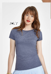
MIXED WOMEN 01181