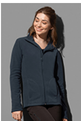
ST5100 Fleece Jacket