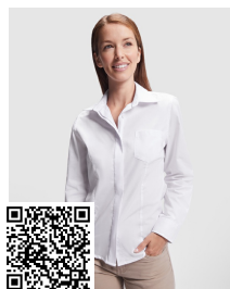
SOFIA L/S CM5161