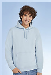
SOL'S SPENCER 02991