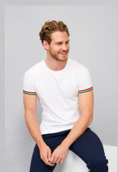
RAINBOW MEN 03108