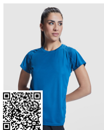
BAHRAIN WOMAN CA0408