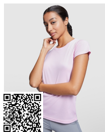
MONTECARLO WOMAN CA0423