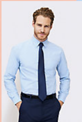
SOL'S BOSTON 16000